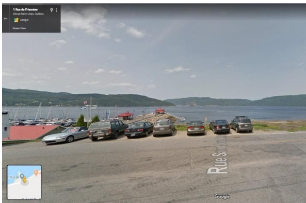
Territoire protégé – Anse Saint-Jean (fjord du Saguenay) ( https://goo.gl/maps/4sVHTVHKaxn67EK38 )