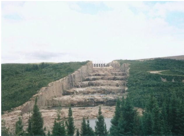
Territoire énergétique – Aménagement Robert-Bourassa (Baie-James) ( http://monde.ccdmd.qc.ca/ressource/?id=18354&demande=desc# )