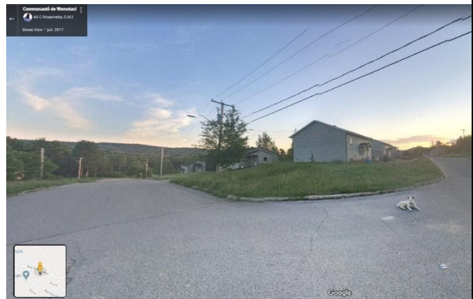
Territoire autochtone – Communauté de Wemotaci ( https://goo.gl/maps/78wd3KxnJVdeq5Cx7 )